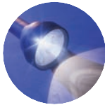
ADNOD ALLWEDDOL Galatiaid 6: 7