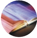
DARLLENWCH Genesis 29: 1-30