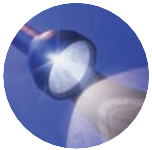
ADNOD ALLWEDDOL Luc 1: 37

Gofynnwch am help i chwilio am yr adnod hon